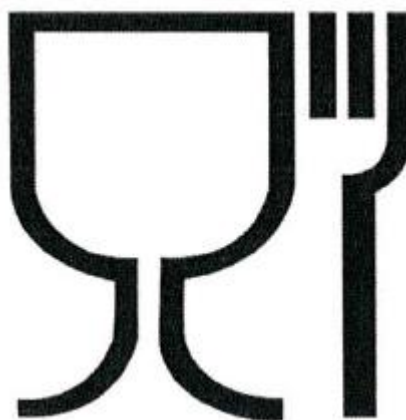
Рис.1. Упаковка (укупорочные средства), предназначенная для контакта с пищевой продукцией Символ, обозначающий, что упаковка предназначена для контакта с пищевой продукцией, допускается наносить как без рамки, так и в рамке (круглой, квадратной и др.).